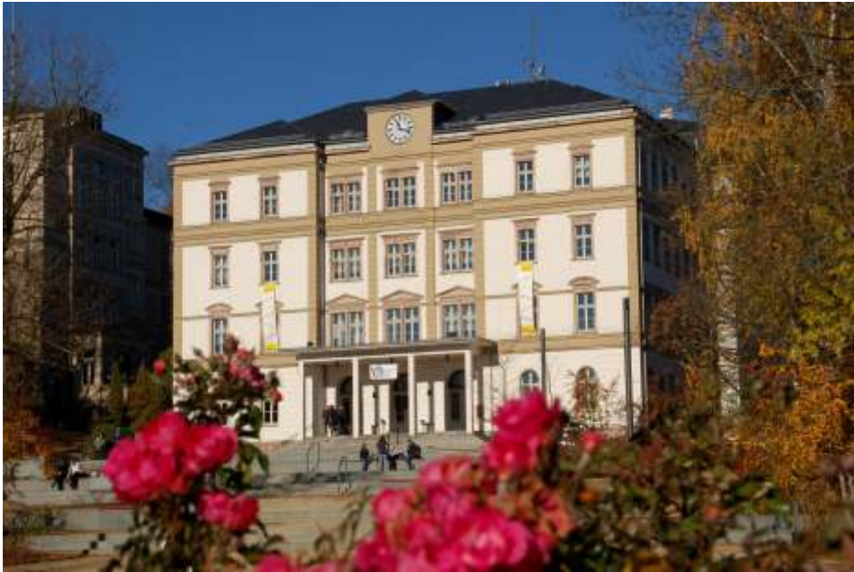
Mittweida ist nun auch offiziell „Hochschulstadt“. Hier ein Blick auf das Hauptgebäude der Hochschule – den Carl-Georg-Weitzel-Bau.

Was schon längst zum allgemeinen Sprachgebrauch gehörte, ist nun offiziell: Mittweida darf sich als erste Stadt im Freistaat Sachsen „Hochschulstadt“ nennen.