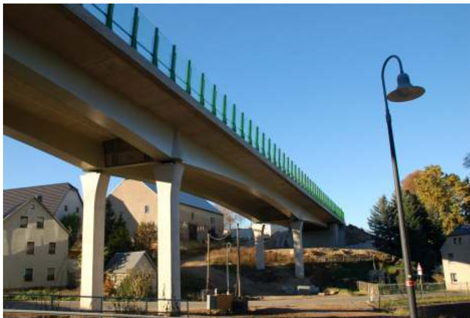
Die neue Straßenbrücke in Ottendorf sorgt für eine schnellere verkehrstechnische Anbindung der Region Mittweida.

Endlich „flutscht“ der Straßenverkehr aus und in Richtung Chemnitz über Ottendorf wieder. Und das komfortabler und schneller als je zuvor: Nach reichlich zwei Jahren Bauzeit erfolgt die Verkehrsführung nun oberhalb der Ortslage Ottendorf und trifft dann wieder auf die bisherige Trasse der Staatsstraße 200 zwischen Mittweida und Chemnitz. Durch diese schnellere Verbindung nach Chemnitz beziehungsweise Oberlichtenau, wo sich die Autobahnauf- beziehungsweise Autobahnabfahrt befindet, können potenzielle Investoren jetzt viel besser auch auf dem Land investieren.