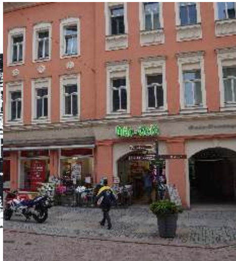
09648 Mittweida, Rochlitzer Straße 4-8 im Jahre 1925 (links) und 2015 (rechts).

Die Gebäude der Rochlitzer Straße 4 bis 8 spiegeln anschaulich einen Teil der gesellschaftlichen und wirtschaftlichen Entwicklung Mittweidas wider. Immer wieder gab es in der Historie dieser geschichtsträchtigen Häuser Geschäftswechsel sowie Nutzungsänderungen.