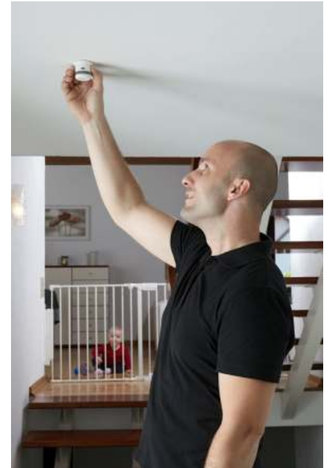
An der Zimmerdecke befestigt, kann ein Rauchmelder helfen, Leben zu retten.

Abhilfe schaffen hier Rauchmelder, die fest im Haus installiert sind. Sobald Qualm aufsteigt und an die Geräte gelangt, ertönt ein lauter, gut hörbarer Warnton, der auch Schlafende sofort aufweckt. Das Gerät arbeitet mit einer Lithiumbatterie mit einer Lebensdauer von rund fünf Jahren und kann daher unabhängig vom Stromkreis betrieben werden. Der kompakte Melder in neutralem Weiß wird an der Zimmerdecke befestigt. Eine Kontrollleuchte zeigt dauerhaft an, ob der Rauchmelder in Bereitschaft steht. Der Alarmton, der im Notfall anspringt, ist 85 dB laut - also etwa so wie der Lärm am Rand einer viel befahrenen Straße.