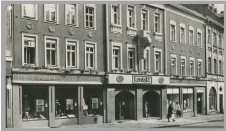
09648 Mittweida, Rochlitzer Straße 4-8

Winter 2015 / 2016 Das Immobilienmagazin für Mittweida